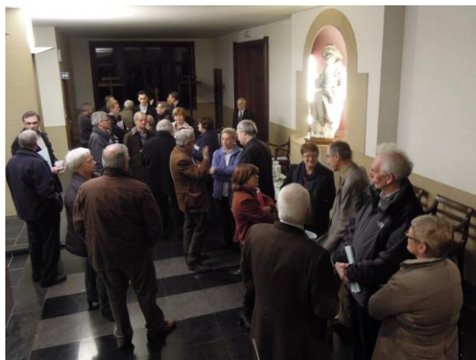
Foto: tijdens de pauze van de Ronde van schoolbesturen in Mechelen in november 2012

Het VSKO vroeg aan elk vicariaat onderwijs om voor het eigen bisdom een blauwdruk te maken van hoe het contingent bereikt kan worden en wat de mogelijke knelpunten zijn. Dat is een bijzonder moeilijke oefening. Voor het aartsbisdom moet je niet alleen 192 schoolbesturen (voor het leerplichtonderwijs) kunnen reduceren tot 24 à 25. Bij de simulaties moet je ook rekening houden met wat de congregationele besturen van plan zijn: wensen ze al hun scholen regio-overschrijdend en zelfs interdiocesaan bij elkaar te houden? Blijven ze daarbij of staan ze open voor structurele samenwerking met andere besturen en onder welke voorwaarden? Willen ze motor zijn van schaalvergroting in een regio met de intentie om tot een totaal nieuw bestuur te komen, waar hun impact beperkter zou zijn? Allemaal vragen waarvan de antwoorden erg bepalend kunnen zijn voor de vorming van grotere besturen. Simulaties opstellen van achter een bureau, met alleen cijfers bij de hand, is bovendien nattevingerwerk als je geen rekening houdt met de concrete realiteit op het terrein: welke samenwerkingsverbanden zijn er al? Welke ervaringen uit het verleden leren ons dat bepaalde constructies al dan niet zullen werken? Welke meerwaarde kan een bestuurlijke eenheid vormen voor elk van de partnerbesturen? Met welke structuur is het katholiek onderwijs in de regio het best gediend?