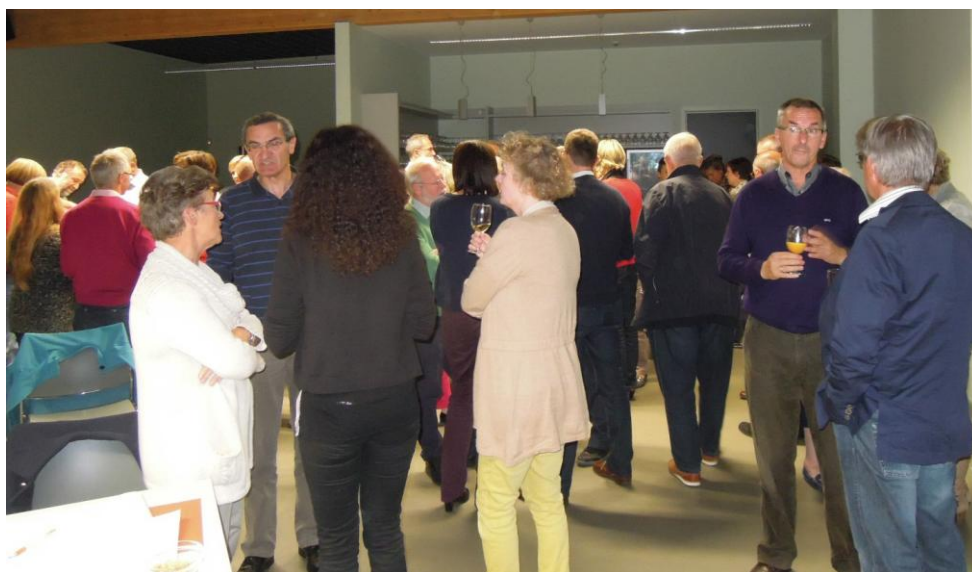
Foto: tijdens de pauze van de infosessie in Liedekerke op 8 oktober 2013.

Het zijn drukke tijden voor de Dienst Schoolorganisatie van het Vicariaat onderwijs. Uit heel wat regio's komen uitnodigingen van schoolbesturen of scholengemeenschappen om aanwezig te zijn of toelichting te geven bij infovergaderingen. Voor zover de agenda het toelaat wil de directeur, als enige vrijgestelde, daar graag op ingaan. Het werk blijft daar niet toe beperkt. Het opstellen van een voorlopige blauwdruk vroeg al heel veel werk. De vraag naar organisatiemodellen is bijzonder groot en dat wordt dus een volgende uitdaging. Anderzijds is het nergens voor nodig om overhaast tewerk te gaan. De verkenningsfase waar we voor staan moet voldoende tijd krijgen. We vragen de schoolbesturen ook om nog geen verregaande verbintenissen aan te gaan. Bovendien ziet het ernaar uit dat er deze legislatuur geen decreet over bestuurlijke schaalvergroting meer komt, nu het voorontwerp van decreet is afgeschoten door ondermeer de vakbonden en ook de onderwijskoepels bezwaren uiten.