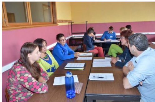
Boven en onder: een paar werkwinkels uit de keuze van 15. Midden rechts: kinderen van de Sint-Norbertusschool Heverlee brachten het 'opendeurlied'. Midden links: twee improviserende (leken)zusters

lied van de open deur te zingen en te dansen, elk gekleed in een T-shirt met de afbeelding van kleurige deurtjes erop. Twee leerkrachten van de Sint-Jozefsschool van Sint-Agatha-Berchem, verkleed als zusters, sloten samen met Frans al improviserend de dag af. Daarbij mocht eenieder