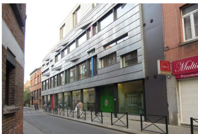
De futuristische voorgevel in zink van de gerenoveerde Vierwindenschool in Sint-Jans-Molenbeek

In hartje Sint-Jans-Molenbeek, in een wijk die niet aangeschreven staat als de meest aantrekkelijke, durfde een katholiek schoolbestuur het aan om zwaar te investeren in de renovatie van uitgeleefde en ontoereikende infrastructuur. De school heet de Vierwindenschool, genoemd naar een gelijknamige straat in de buurt, maar de naam lijkt ook perfect de multiculturele samenstelling van de schoolbevolking (uit de vier windstreken) weer te geven. De extreme make-over mag gezien worden. Het nieuw-ogende gebouw werd op 27 september plechtig geopend.