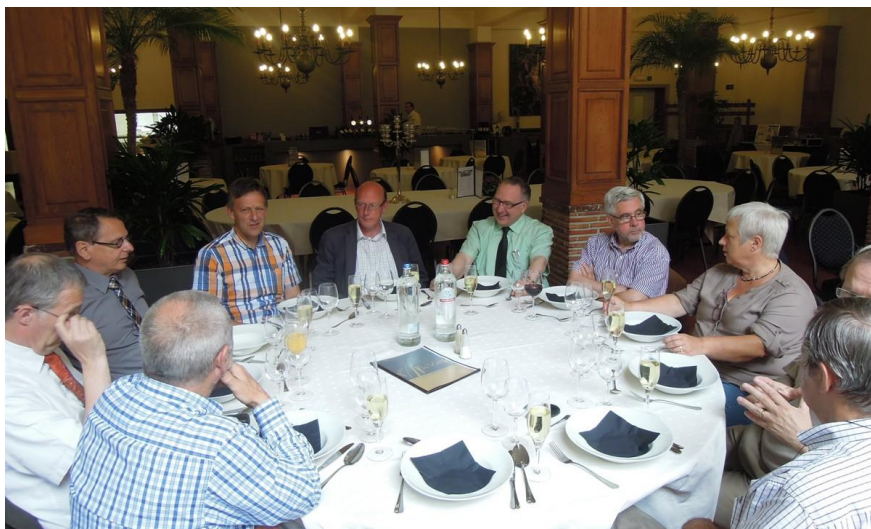
Leden van het Diocesaan Comité Inrichtende Machten tijdens het dankentje op het einde van vorig schooljaar.

Met de Ronde van schoolbesturen die het Vicariaat onderwijs, samen met het Diocesaan Comité van Inrichtende Machten (DCIM) van het aartsbisdom Mechelen-Brussel vorig schooljaar heeft georganiseerd in alle uithoeken van het bisdom, gaven ze de aanzet tot verdere reflectie over versterking van schoolbesturen. Op de jaarvergadering voor schoolbestuurders van 4 juni 2013 kon iedereen kennis nemen van het eindrapport van de Ronde. De tekst werd naar alle bestuurders gestuurd, samen met een leidraad voor verdere gesprekken in elk schoolbestuur. Intussen is alvast één van de doelstellingen bereikt: het werkveld is wakker geschoten, initiatieven om schoolbesturen regionaal samen te brengen voor informatie-uitwisseling en overleg schieten als paddenstoelen uit de grond, maar veroorzaken hier en daar ook onrust.