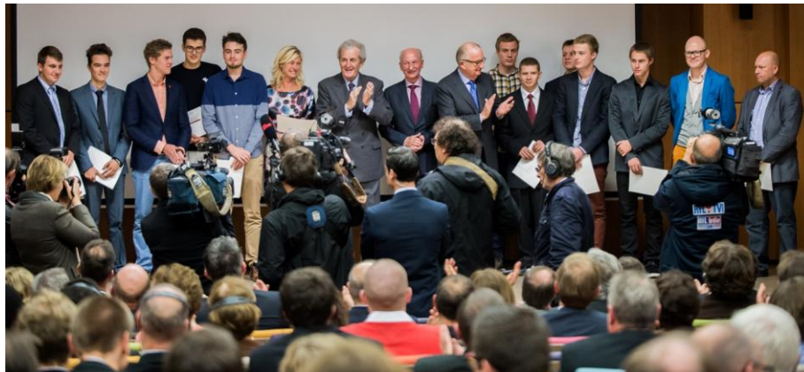
Rechts: de Vlaamse laureaten Onder: Dirk Frimout, juryvoorzitter

vermeldingen weg, goed voor 100 euro per leerling en 200 euro voor de school. Het project dat ze indienden was een 'zonnevolgend zonnepaneel' vanuit hun interesse voor alternatieve energiebronnen. Ze monteerden het zonnepaneel op een draaibare constructie die automatisch het zonlicht volgt door middel van sensoren. Van harte proficiat.