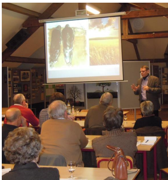
Tijdens de Ronde van schoolbesturen, in Virgo Sapiens Londerzeel op 23 januari 2013.