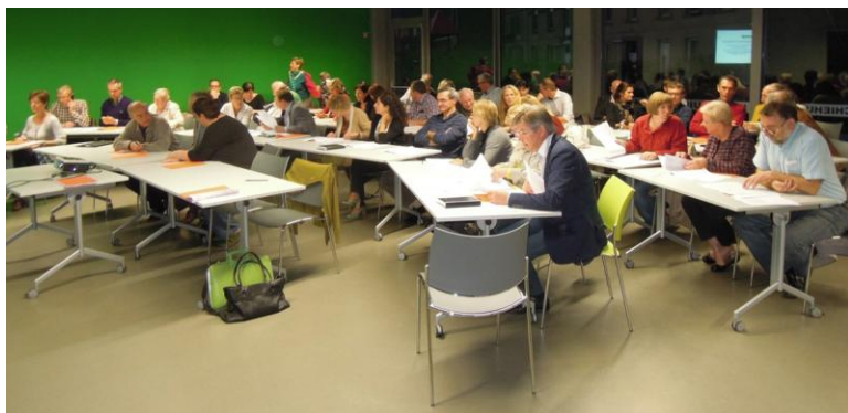
Infovergadering over schaalvergroting voor schoolbestuurders en directeurs met coördinerende functie, in het parochiehuis in Liedekerke, op 8 oktober 2013.